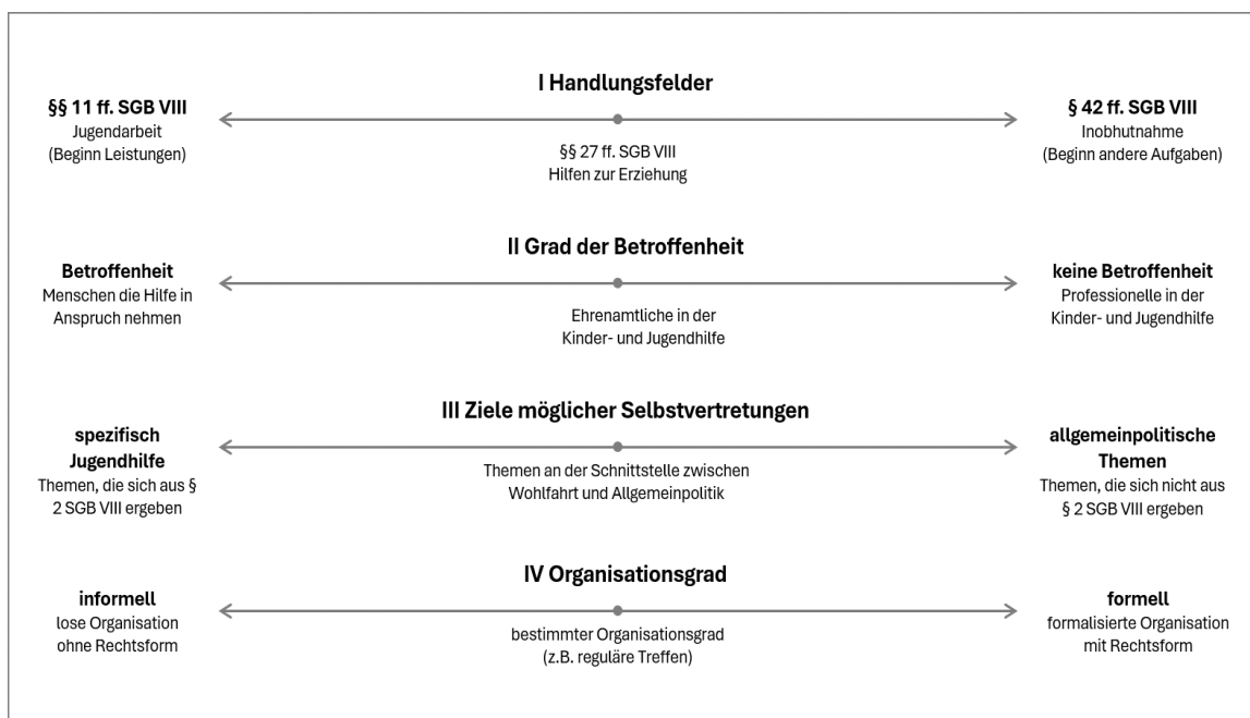
Abbildung II: Dimensionen des § 4a SGB VIII (eigene Darstellung)

Im Rahmen der Auseinandersetzung mit den Bestimmungen des § 4a SGB VIII, konnten vier zentrale Dimensionen identifiziert werden, welche die verschiedenen Lesarten und potenziellen Konfliktpunkte der Norm verdeutlichen. Die folgende Grafik 2 stellt dabei die vier Dimensionen sowie den Stand der Diskussion um den Paragraphen dar (Abb. II).